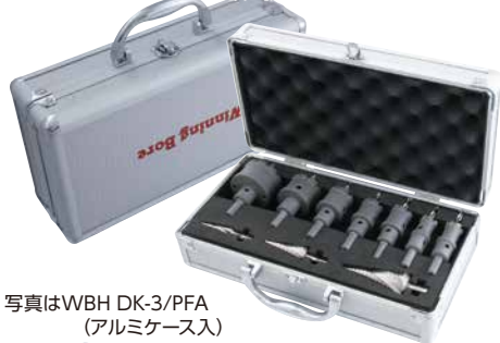
写真はWBH DK-3/PFA (アルミケース入)

ハイスピードカッター(WBH)と ピラミッドドリル(RSD)をアルミケースに きっちり収納、整理整頓、紛失防止に最適です。