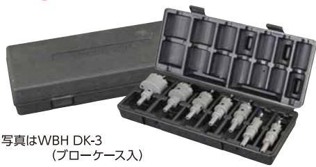
写真はWBH DK-3 (ブローケース入)