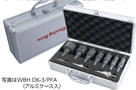
写真はWBH DK-3/PFA (アルミケース入)

ハイスピードカッター(WBH)とピラミッドドリル(RSD)をアルミケースにきっちり収納、整理整頓、紛失防止に最適です。