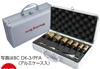
写真はBC DK-3/PFA (アルミケース入)