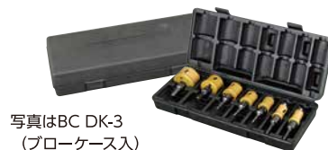
写真はBC DK-3 (ブローケース入)