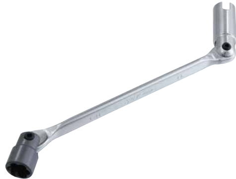
左ネジ緩め専用 特殊ソケット13mm

■ 刈払機(草刈機)左ネジ緩め専用の ツイストソケット と 蝶ネジ にも使用できる 13ミリロングソケット を両端に取り付けた ダブルフレックスレンチ 。早回し作業、また本締め作業にとっても便利です。