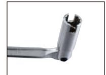
13mm&蝶ネジ回し 締め・緩め用

磨り減ったボルトやナットにガッチリと噛み込んで簡単に緩める事ができる 特殊ソケット です。