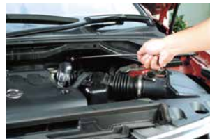
◆エンジンルームの点検に。