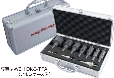
写真はWBH DK-3/PFA (アルミケース入)

ハイスピードカッター(WBH)と ピラミッドドリル(RSD)をアルミケースに きっちり収納、整理整頓、紛失防止に最適です。