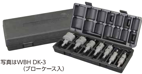
写真はWBH DK-3 (フローケース入)