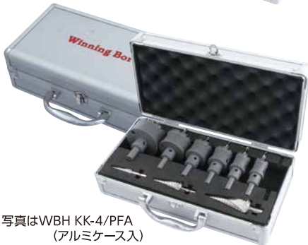
写真はWBH KK-4/PFA (アルミケース入)