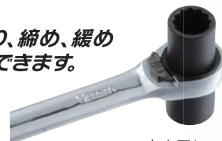
左右回転 切替レバー付き

左右切替レバーにより、締め、緩め 作業がスピーディーにできます。 (8 - 12ミリ側2カ所)