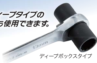
ディープボックスタイプ