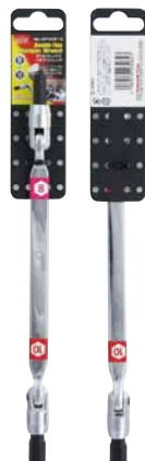
DOUBLE FLEX HEXAGON WRENCH ダブルフレックスヘキサゴンレンチ