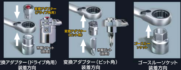
変換アダプター(ドライブ角用) 装着方向 変換アダプター(ビット用) 装着方向 ゴースルーソケット 装着方向

■リバースギアレレンチセット 標準付属品 装着例 アタッチメントの組み合わせにより様々な場面で活躍します。