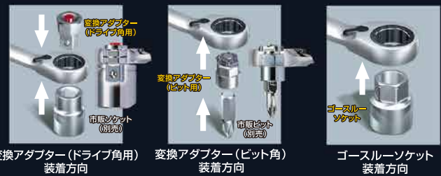
変換アダプター(ドライブ角用) 装着方向