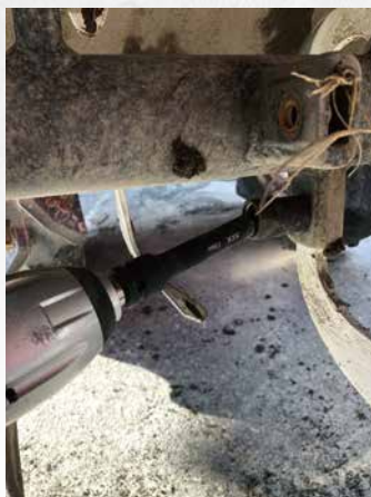
使用例 トラクターの爪交換作業に