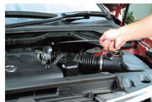
◆エンジンルームの点検に。