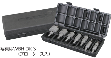
写真はWBH DK-3 (ブローケース入)