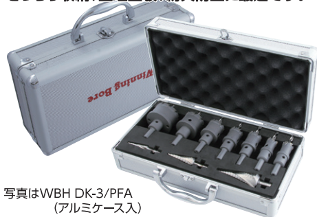
写真はWBH DK-3/PFA (アルミケース入)

ハイスピードカッター(WBH)とピラミッドドリル(RSD)をアルミケースにきっちり収納、整理整頓、紛失防止に最適です。