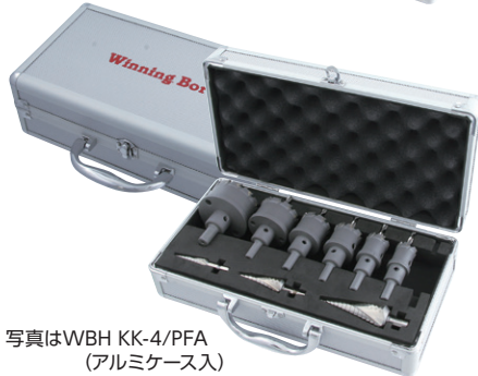
写真はWBH KK-4/PFA (アルミケース入)