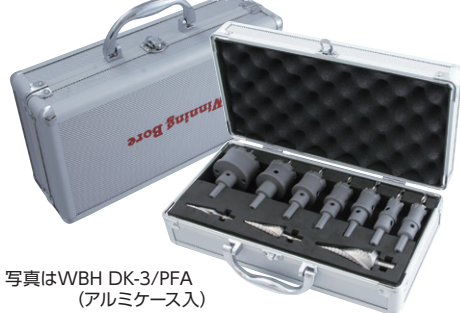
写真はWBH DK-3/PFA (アルミケース入)

ハイスピードカッター(WBH)と ピラミッドドリル(RSD)をアルミケースに きっちりと収納、整理整頓、紛失防止に最適です。