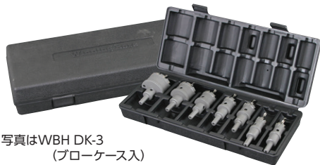
写真はWBH DK-3 (ブローケース入)