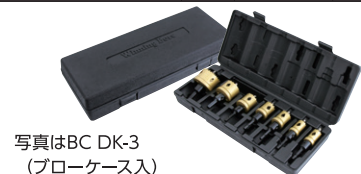
写真はBC DK-3 (ブローケース入)