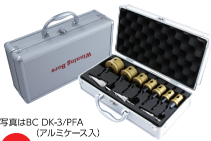
写真はBC DK-3/PFA (アルミケース入)