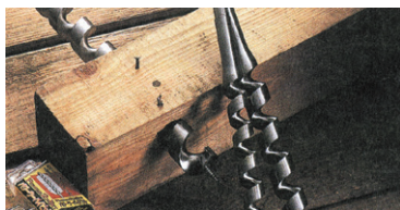
従来の木工用ドリル