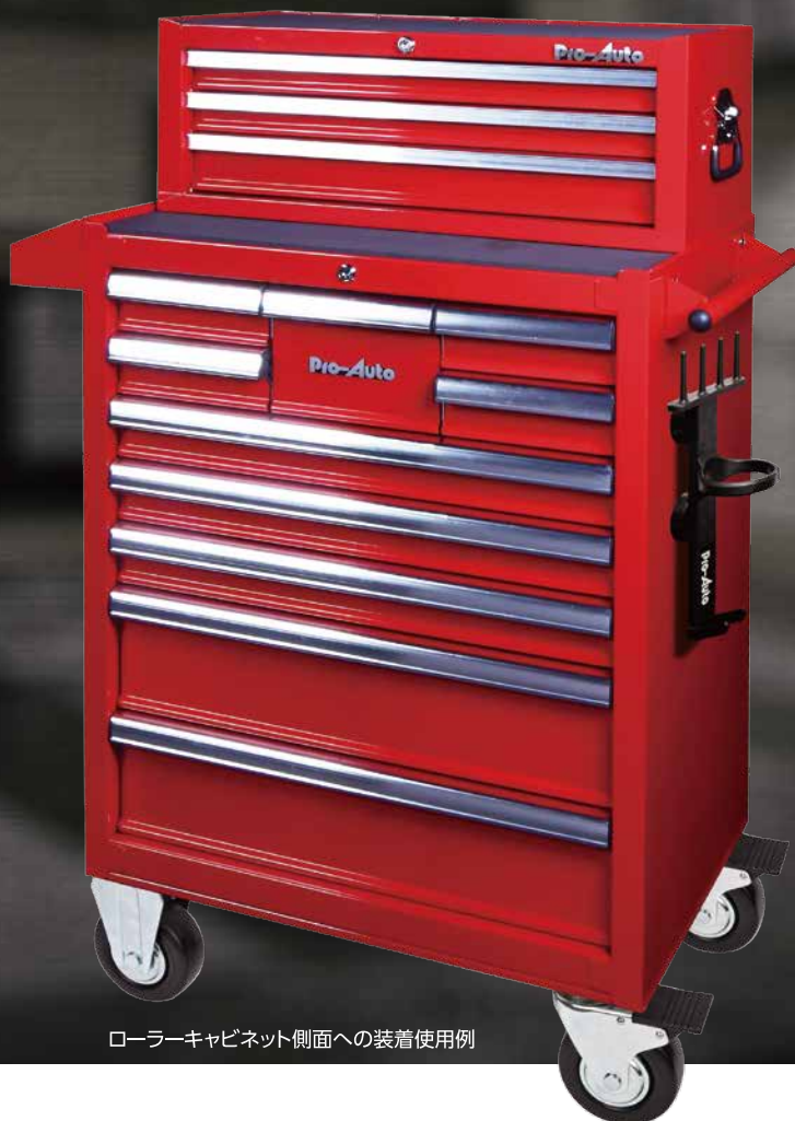
ローラーキャビネット側面への装着使用例