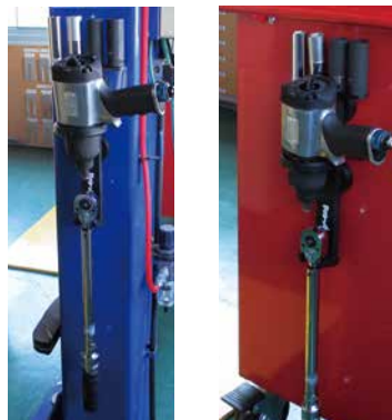
工具、レンチ収納使用例