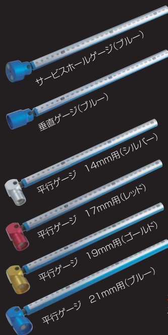
サービスホールゲージ用 アタッチメント 6・10・15・20mm