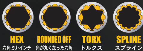
スプラインソケットサイズ適応表