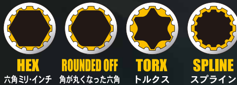
スプラインソケットサイズ適応表