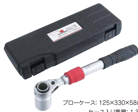
フローケース: 125×330×58mm ケース入り重量: 1.3kg

SUEKAGE TOOL 公式 Facebook 新製品情報 やセール、イベント情報などを紹介しています。 あなたの『いいね!』をお待ちしております!!