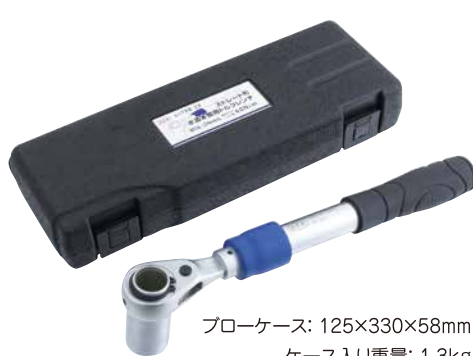
フローケース: 125×330×58mm ケース入り重量: 1.3kg